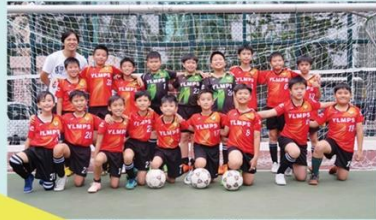
足球隊連續八年在葵涌區小學校際足球比賽中奪得獎項。