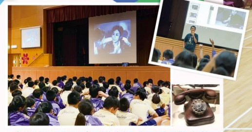
全級二年級學生參加了保良局生涯規劃及理財教育中心主辦的「錢家有道小學理財大使」計劃，以桌遊方式教導學生理財概念。