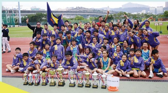
田徑隊在葵涌區小學校際田徑比賽中取得豐收成績。