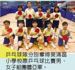
乒乓球隊分別奪得葵涌區小學校際乒乓球比賽男、女子團體亞軍。