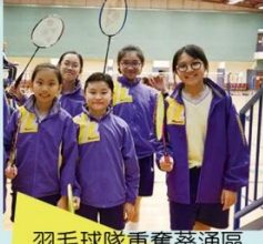
羽毛球隊重奪葵涌區小學校際羽毛球比賽女子組團體冠軍。