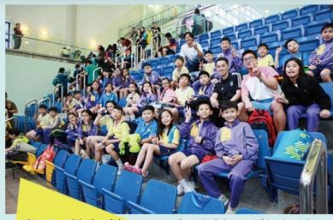
游泳隊在葵涌區小學校際游泳比賽中奪得不少獎項。