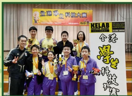
STEM小隊成員參加了「2019全港學生科技大賽」獲得速度賽亞軍及季軍。學生透過設計、製造及測試電動爬山車，從中認識爬山車的運作原理。